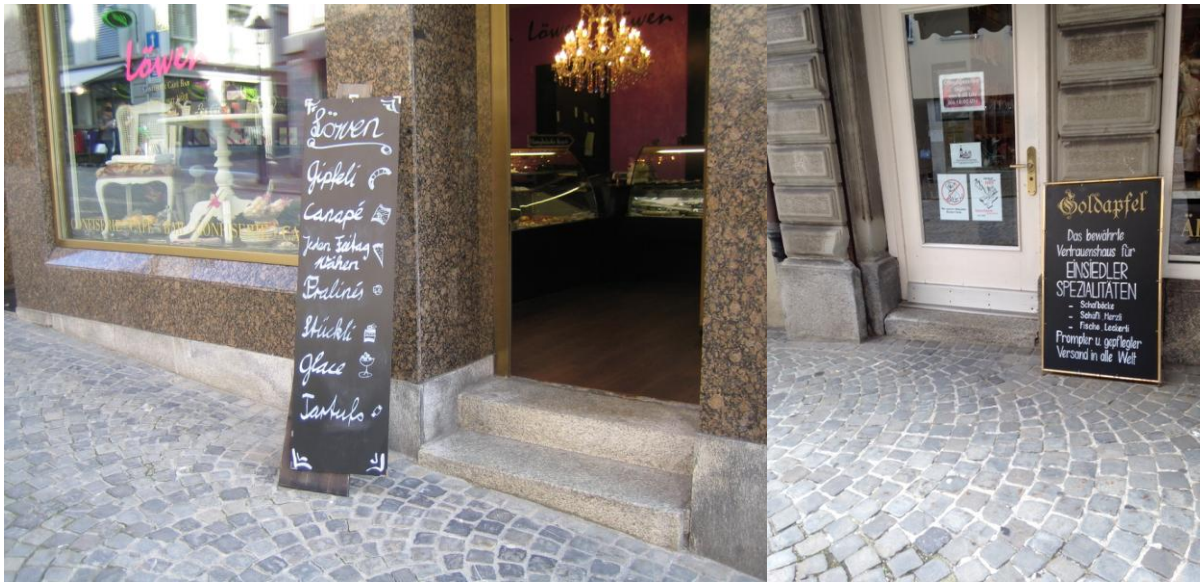
Beispiele individueller Tafeln als Kundenstopper

Vom Bezirksrat Einsiedeln mit BRB Nr. 45 vom 25. März 2015 erlassen.