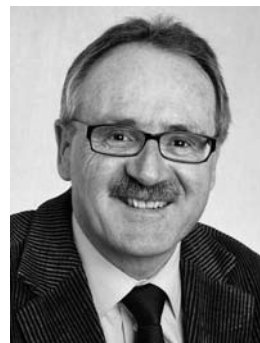
Kurt Zibung Regierungsrat

Zögern Sie nicht, sich bei Fragen an die zuständigen Verwaltungsstellen zu wenden. Erste Anlaufstelle ist Ihre Gemeindeverwaltung. Das Kompetenzzentrum für Integration KomIn in Goldau und Pfäffikon vermittelt Ihnen auf Wunsch gerne persönliche Informationen und berät Sie auf Ihrem Integrationsweg.