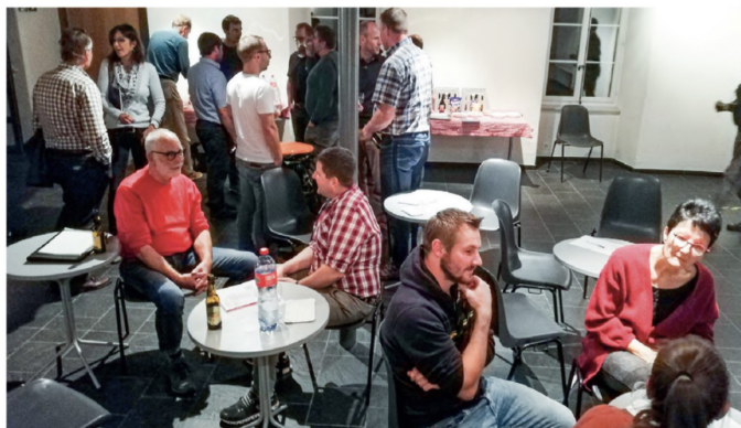
Regelr Austausch nach der Orientierung der sieben Genossamen durch die Ausstellungsgruppe über das nächste Projekt im Chärnehus.

— Weitere Informationen folgen. www.chaernehus.ch