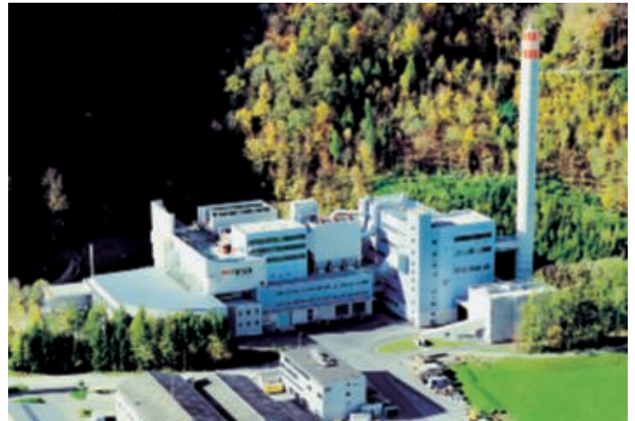
Die heutige moderne Verbrennungsanlage KVA Linthgebiet

So haben sich auch die Kehrrechtverbrennungsanlagen im Verlauf der zurückliegenden drei Jahrzehnte von reinen Vernichtungseinrichtungen für Siedlungsabfälle zu hochtechnischen Prozessanlagen im weit gespannten Feld der Umwelttechnik gewandelt. Die KVA Linthgebiet steht als Beispiel dafür; sie liefert im europäischen Vergleich bei den umweltbezogenen Kriterien absolute Spitzenwerte. Neben der ökologischen Verpflichtung steht auch