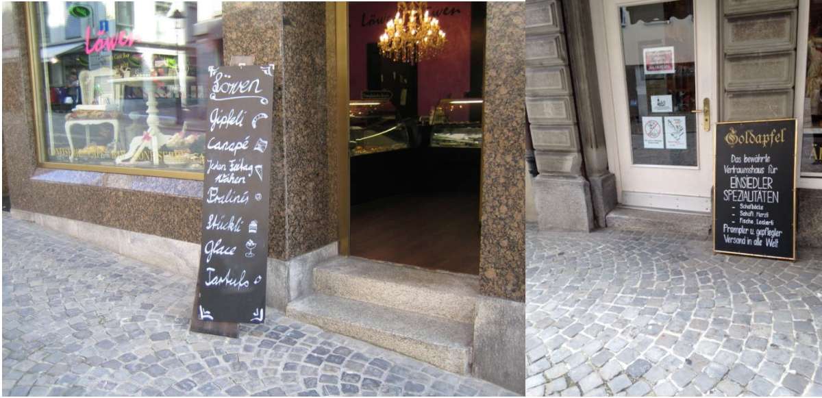
Beispiele individueller Tafeln als Kundenstopper

Vom Bezirksrat Einsiedeln mit BRB Nr. 45 vom 25. März 2015 erlassen.